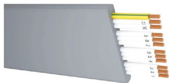
کابل های کنترل تخت ( H05VVH2 - F , H05VVH6 - F , H07VVH2 - F , H07VVH6 - F )