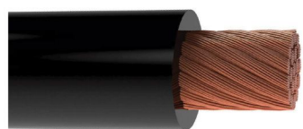
سیم های افشان بدون هالوژن و کم دود ( H05Z - K , H07Z - K )